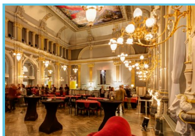
Théâtre de Namur