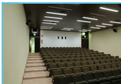
Musée Royal Mariemont

Chaussée De Mariemont 100 Morlanwez - 7140