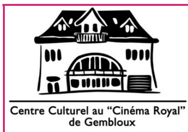
Centre Culturel au "Cinéma Royal" de Gembloux