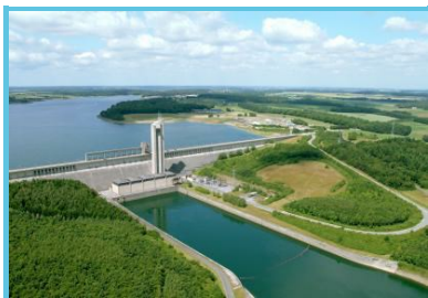
FT Province de Namur